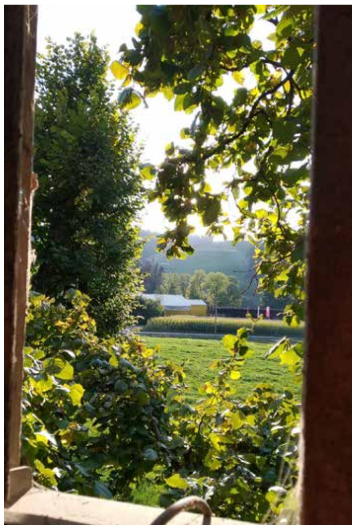
Concours photo 2019: Camila Saldariaga (chez Fam. Nyffenegger)