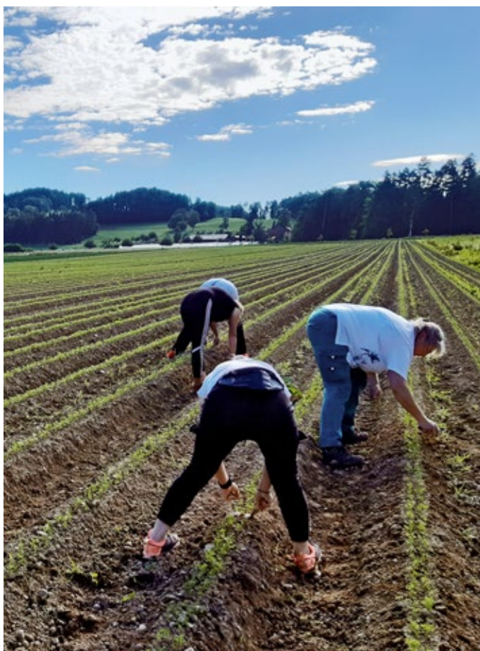
Travail au champ chez la famille Bachmann

La famille Bachmann s'exprime au nom de plus de 400 familles actives chez Agriviva. Toutes voient dans l'échange direct avec les jeunes une grande opportunité d'offrir aux futurs consommateurs et électeurs un aperçu authentique de l'agriculture moderne et une précieuse expérience de vie.