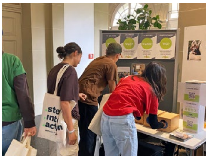
Sommet de step into action à Berne

Même à l'ère du marketing numérique, l'efficacité d'une approche personnelle des jeunes et des familles d'accueil intéressées ne doit être sous-estimée. Une approche mixte est essentielle. En 2023, Agriviva a participé à seize manifestations nationales. Son nouveau stand a suscité la curiosité et l'intérêt des jeunes de manière plus ciblée, et la boîte à outils pour les foires a soulagé les antennes de placement dans la planification et la tenue du stand.