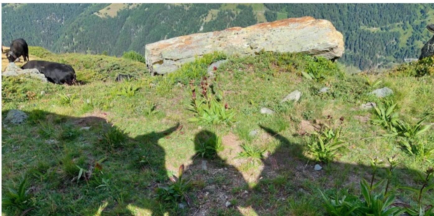
Concours photo : Tabita chez la famille Délèze, Haute-Nandaz (VS)

La hausse des charges en personnel suite à deux changements de poste et les investissements élevés dans l'outil de réservation pèsent lourd dans le budget. Outre les dépenses pour la communication, les charges en personnel et en informatique sont les deux principaux facteurs de coûts. Agriviva boucle l'exercice 2023 sur un résultat de Fr. - 77'892.02. L'optimisation des coûts pour 2024 est en cours.